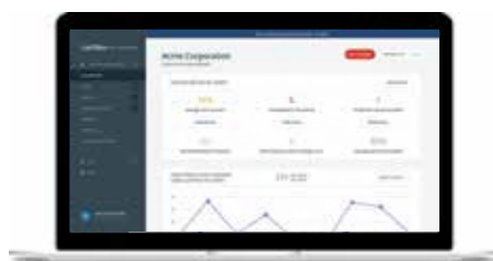
Консоль администратора формирует целостное представление о доступе пользователей во всей организации.

Консоль администратора поддерживает 100 настраиваемых политик безопасности и подробные журналы с отчетностью. Она представляет собой командный центр для развертывания LastPass Enterprise в компании и защиты доступа пользователей во всей организации.